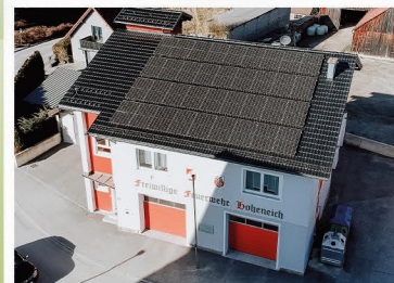
PV Anlage FF-Hoheneich

Lassen Sie uns gemeinsam den Weg zu einer nachhaltigen Zukunft einschlagen. Gemeinsam gestalten wir eine grünere Zukunft für kommende Generationen. Jeder Schritt zählt auf unserem Weg zu einer umweltbewussten und nachhaltigen Gesellschaft.