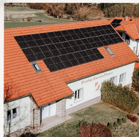
PV Anlage FF-Nondorf